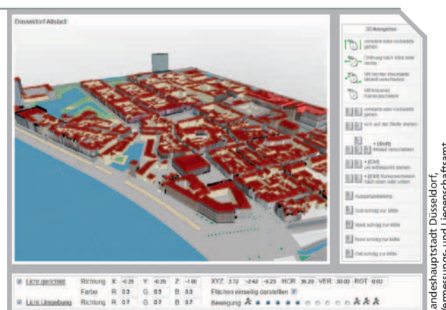
Darstellung dreidimensionaler Objekte im Browser via WebGL, hier am Beispiel des Stadtmodells Düsseldorf.

Die Industrie schießt dabei vor allem auf die Darstellung von Grafiken bei mobilen Spiele-Anwendungen. WebGL ist derzeit noch nicht die einzige Lösung zur Visualisierung von 3D-Modellen im Webbrowser, wird aber vermutlich in Zukunft unentbehrlich sein.